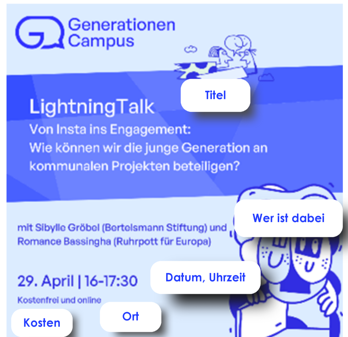
Social-Media-Post des GenerationenCampus zu einer Veranstaltung

Mit einer klaren Strategie, kreativem Content und passenden Tools lässt sich Social Media gezielt nutzen, um junge Menschen zu informieren, zu aktivieren und in Projekte einzubinden.